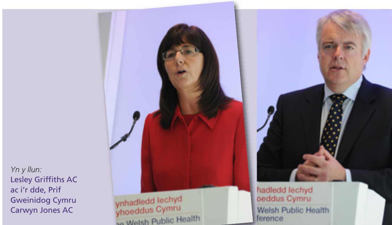
Yn y llun: Lesley Griffiths AC ac i'r dde, Prif Gweinidog Cymru Carwyn Jones AC

Edrychodd y gwaith ar ddsbarthiad fferyllfeydd cymunedol yn ôl cwintelau amddifadedd ar gyfer Cymru ac ar gyfer bob un o'r byrddau iechyd.