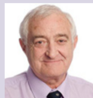
Yr Athro Syr Mansel Aylward

Hoffwn ddiolch i'm cydweithwyr ar Fwrdd Iechyd Cyhoeddus Cymru. Rwy'n falch iawn o'r ffordd yr ydym wedi mynd i'r afael â materion y mae'r sefydliad yn eu hwynebu ac rwy'n ddiolchgar iddynt a'n staff am eu hymrwymiad i wneud Cymru'n lle iachach, hapusach a thecach i fyw.