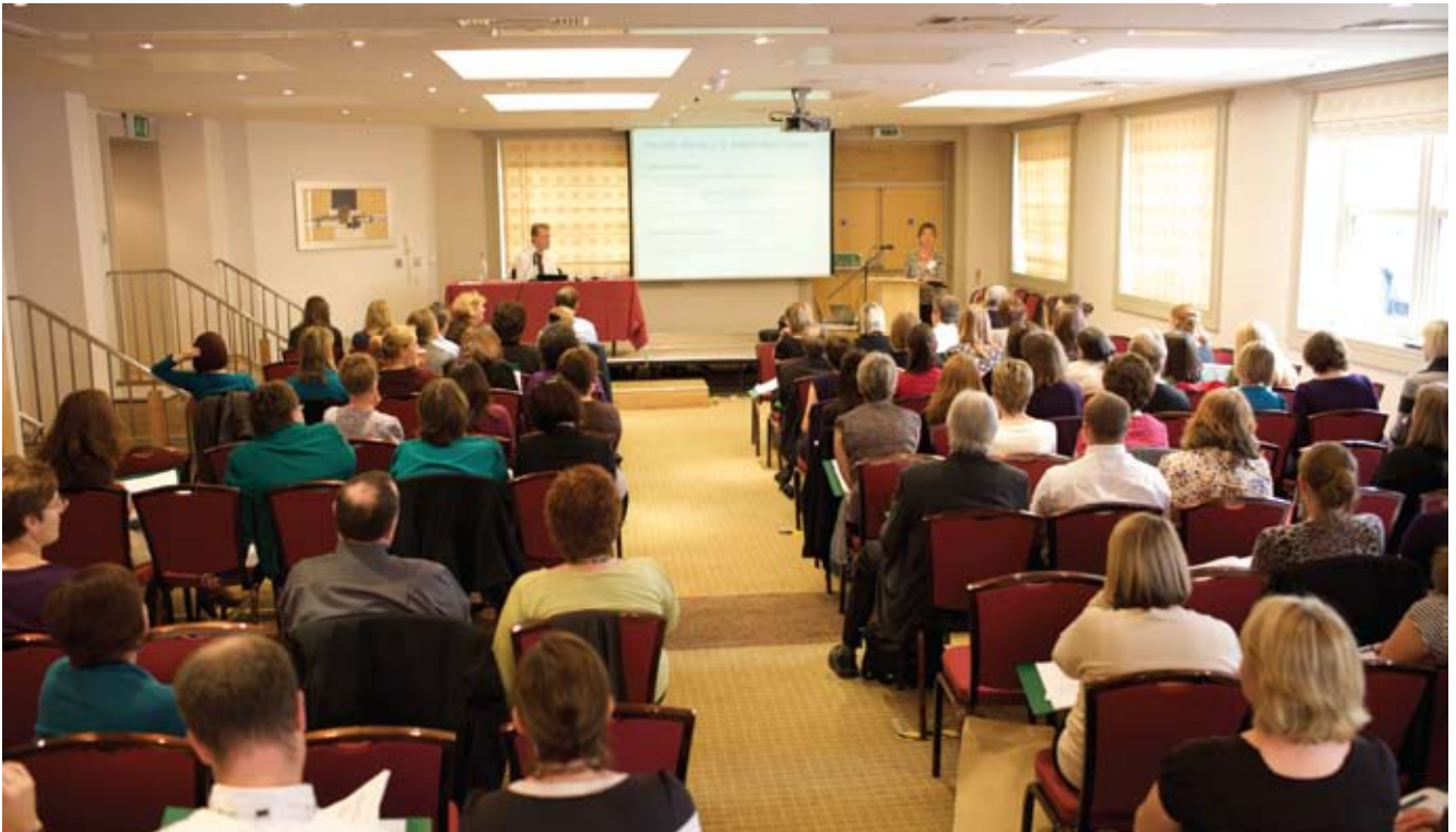
Mynychodd dros 220 o aelodau o staff gynhadledd staff gyntaf Iechyd Cyhoeddus Cymru a gynhaliwyd fis Hydref 2009

Ar 1 Hydref 2009 etifeddodd Iechyd Cyhoeddus Cymru staff gan y tri sefydliad a'i rhagflaenodd. Ar 31 Mawrth 2010 roedd gan Iechyd Cyhoeddus Cymru 1,238 o staff sy'n hafal i 1,014.59 o staff llawn amser.