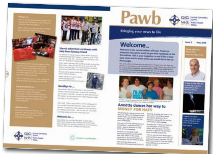
Pawb, y cylchgrawn chwarterol i staff Iechyd Cyhoeddus Cymru

Mae Iechyd Cyhoeddus Cymru wedi datblygu nifer o fesurau i helpu cyfathrebu mewnol yn cynnwys safle mewnwyd, e-Fwletin wythnosol i'r staff a chylchgrawn chwarterol, Pawb, i ddathlu cyflawniadau'r staff. Cynhaliwyd cynhadledd staff fis Hydref 2009 i rannu arferion a gwaith ymchwil arloesol ar draws y sefydliad yn ogystal â helpu'r staff i ddeall y system Iechyd y Cyhoeddus newydd.